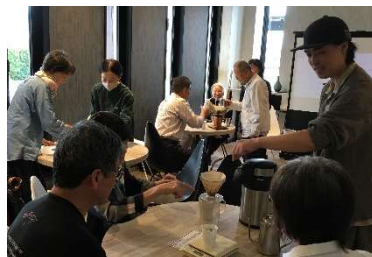
▲コーヒーの淹れ方を教わる様子

講師にまめのもんやさんをお招きし、コーヒーについての基礎知識を聞いて学んだ後は、教わったコーヒーの淹れ方を実際に体験しました。教わった方法で淹れたコーヒーを飲んだ参加者からは「おいしくなった」との声もあり、参加者同士で持参したサーバーのことなどを楽しそうに会話する姿も見られました。館内に広がるコーヒーの香りに図書館スタッフも思わずうっとり。