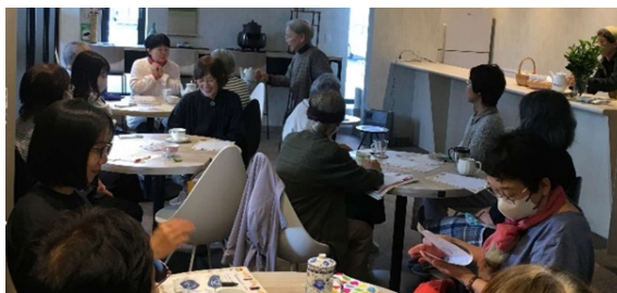
▲紅茶の淹れ方に耳を傾ける皆さん