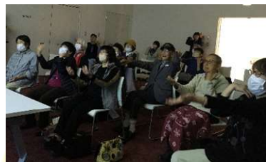
▲回想法のDVDで体を動かす皆さん