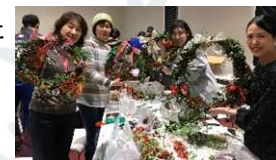
▲完成したリースと

声や「クリスマスリースは初挑戦。思いのほか楽しく、良いリースができて大満足」などの声をいただきました。皆さん素敵なクリスマスを迎えられそうですね。