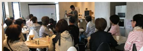
▲講師の話と手元に注目する皆さん