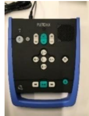
マルチメディアデージー図書 を聞くことのできる機械 (プレクストーク)