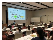
るるパークって どんなところ？