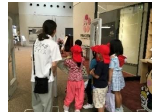
このゲートを通るときに注意することは…

6月20日(木)に八坂小学校の2年生が図書館見学に来てくれました。 「図書館にピアノをおいているのはどうして？」 「いすがたくさんあるのは、どうして？」 「雑誌(ざっし)ってなに？」 など、時間いっぱい、たくさんの質問をしてくれました。図書館のこと、いっぱい知ってこれからもどんどん利用してくださいね。