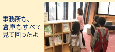
事務所も、倉庫もすべて見て回ったよ