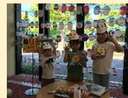
“ゴーリ्यूくんぬりえ”完成！ ゴーリ्यूくんがいっぱいだー