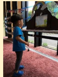
“ひっぱりくじコーナー” うーん、どれにしようかな。

5月3日(金)から5日(日)の3日間行われました。5種類のゲームが登場し、中学生も参加してくれました。なんと全部パーフェクトの子はゼロです！またいつか、図書館で登場するかもしれません。次はパーフェクトをめざせ！