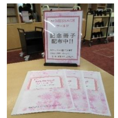
春のメッセージワールド 冊子(さっし)