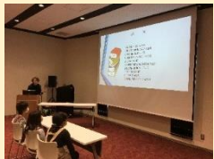
図書館の仕事についての説明