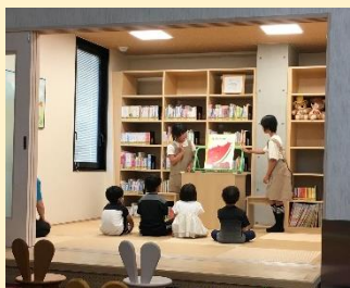
いざ、本番！読み聞かせ会のはじまり～

5月3日(金)に、図書館お仕事体験が行われました。八坂小学校の4年生、護江小学校の4年生、東小学校の5年生の3人の参加です。朝のミーティングから参加し、司書に仲間入り。3人とも初めてとは思えないほど、どんどん仕事をこなしていきます。5月25日(土)の読み聞かせ会も、がんばりました！体験を終えての小学生の感想です。