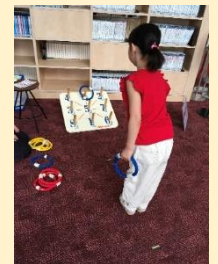
“わなげコーナー” 2回チャンスで景品ゲット！