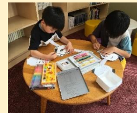
“ぬりえコーナー” 図書館でのぬりえは楽しいね。