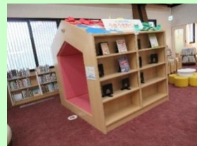
ひみつきちへ移動した 特集コーナー

4月から“ひみつきち”に移動した特集コーナー。職員が「こんな本あるよ」「楽しいよ」と、みんなに紹介したい本を置いています。毎月のテーマにそった本を紹介しているのですが、“ひみつきち”に移動した後は、大人気。ぜひ、児童コーナーで見てほしい場所です。これからもいろいろなテーマの本を紹介していきますので、お楽しみに！